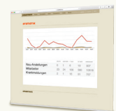
Selbstverwaltung und Reports im Online-Admin

Alle Daten werden zentral und verschlüsselt verwaltet. Sie behalten alle Informationen unter ihrer Kontrolle.