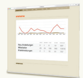
Selbstverwaltung und Reports im Online-Admin

Smartbon ist zeitgemäße Kundenbindung und Kundenaktivierung am Smartphone. Die digitale Kundenkarte erlaubt das Sammeln von Bonuspunkten. Sondervergütungen für besonders treue Kunden und das Werben neuer Kunden werden unterstützt. Gleichzeitig ist die Kundenkarte ein Kommunikationsinstrument. Der Betreiber sendet Angebote und Vouchers auf das Smartphone. Die Empfänger können leicht in präzise Unter-Segmente unterteilt werden, z.B. die 10 besten oder schlechtesten Kunden. Damit verfügt der Betreiber über ein punktgenaues Marketing-Tool das den Kunden immer erreicht. Auf keinem Kanal kommen sie dem Kunden näher als am Smartphone.