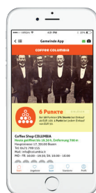
Punkte sammeln & Shop-Info